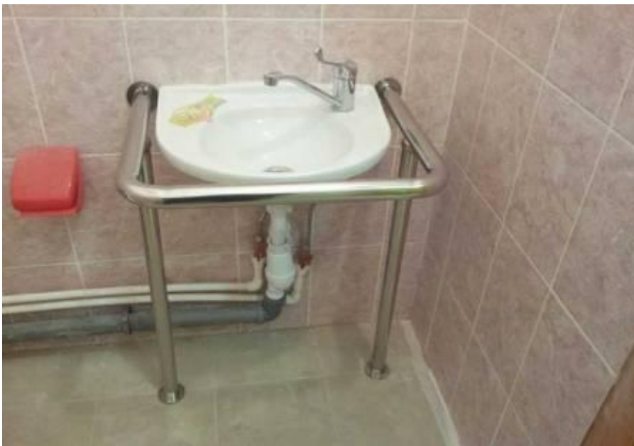
37. Фото «Санитарное состояние помещений организации» (фото размещается только при заявлении показателя в справке)