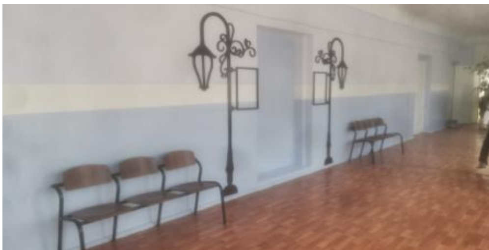
34. Фото «Наличие и понятность навигации внутри организации» (фото размещается только при заявлении показателя в справке)